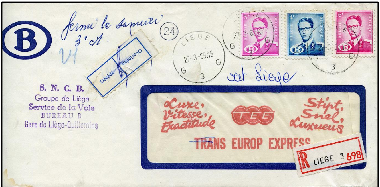
Fig. 2 - Enveloppe avec trois timbres, seul affranchissement possible avec trois timbres Fig. 2 - Omslag met drie zegels, enige frankeringsmogelijkheid met drie zegels