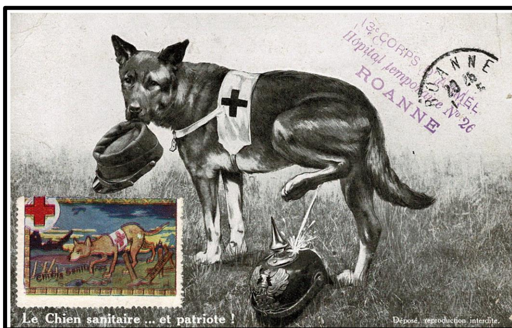
Carte postale expédiée d'un hôpital temporaire de Roanne en 1915.

Des lettres et documents de chaque type de "chiens-soldats" sont montrés.