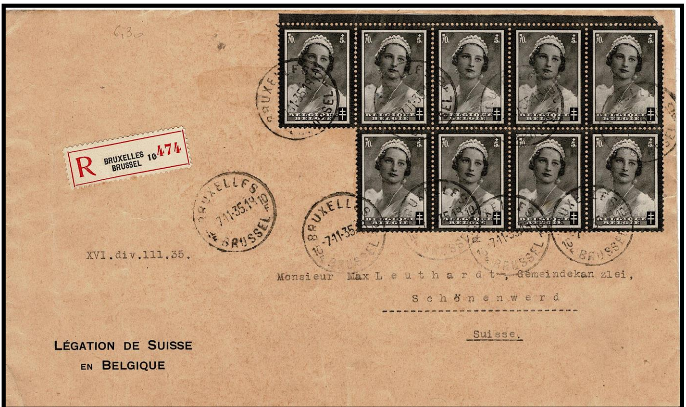
Lettre du 7 novembre 1935, service international, quadruple port

Ensuite nous voyons un ensemble avec tous les tarifs possibles avec ces timbres, aussi bien en courrier intérieur qu'extérieur. Ce qui est remarquable, c'est l'utilisation du grand nombre de timbres à 0,70 FR qui étaient nécessaires pour certains tarifs avant l'émission des grosses valeurs le 1 er décembre 1935.