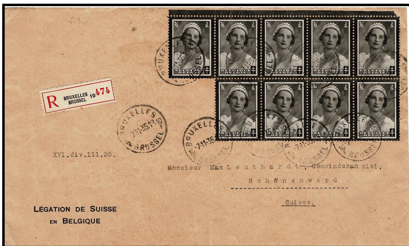
Brief van 7 november 1935, internationale dienst, viervoudig port (gewicht tussen 60 en 80 g.)

Daarna krijgen we een overzicht van alle mogelijke tarieven met deze zegels, zowel met binnenlandse als buitenlandse bestemming. Wat opvalt is het gebruik van het groot aantal zegels van 0,70F die nodig waren voor bepaalde tarieven, vóór de uitgifte van de grotere waarden op 1 december 1935.