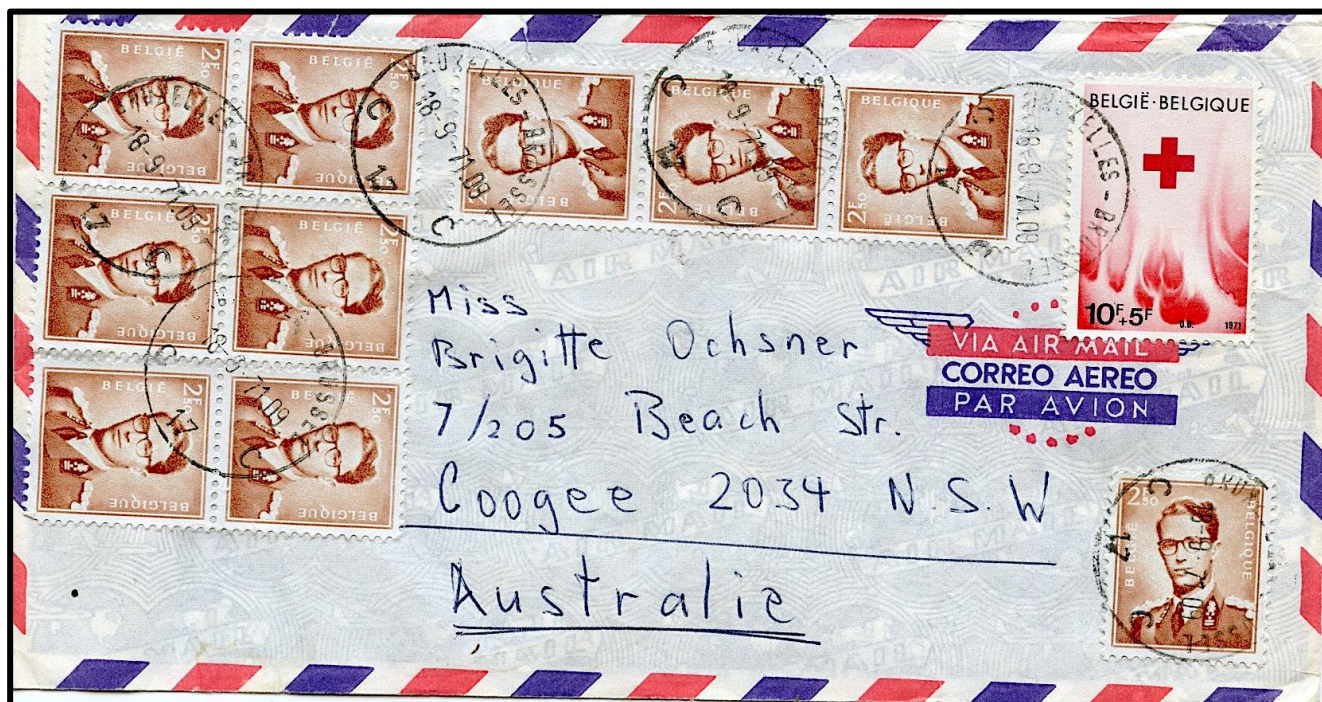
Lettre vers l'Australie du 18 septembre 1971

En plus, sachant que le timbre rouleau du 2,50 fr a été imprimé sur un cylindre différent, nous pouvons être sûr qu'ici aucun timbre rouleau n'a été utilisé !