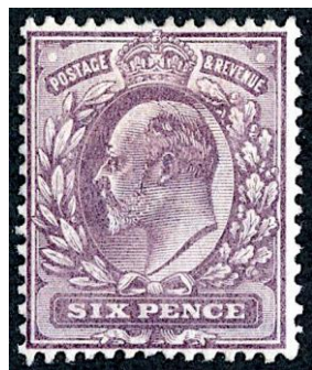
Le timbre authentique

À des centaines de kilomètres de là, dans un train, un homme et une femme, qui avait subi une forte cure de rajeunissement, comptaient ce que la cupidité des marchands leur avait rapporté : 30.000 dollars de 1920 !