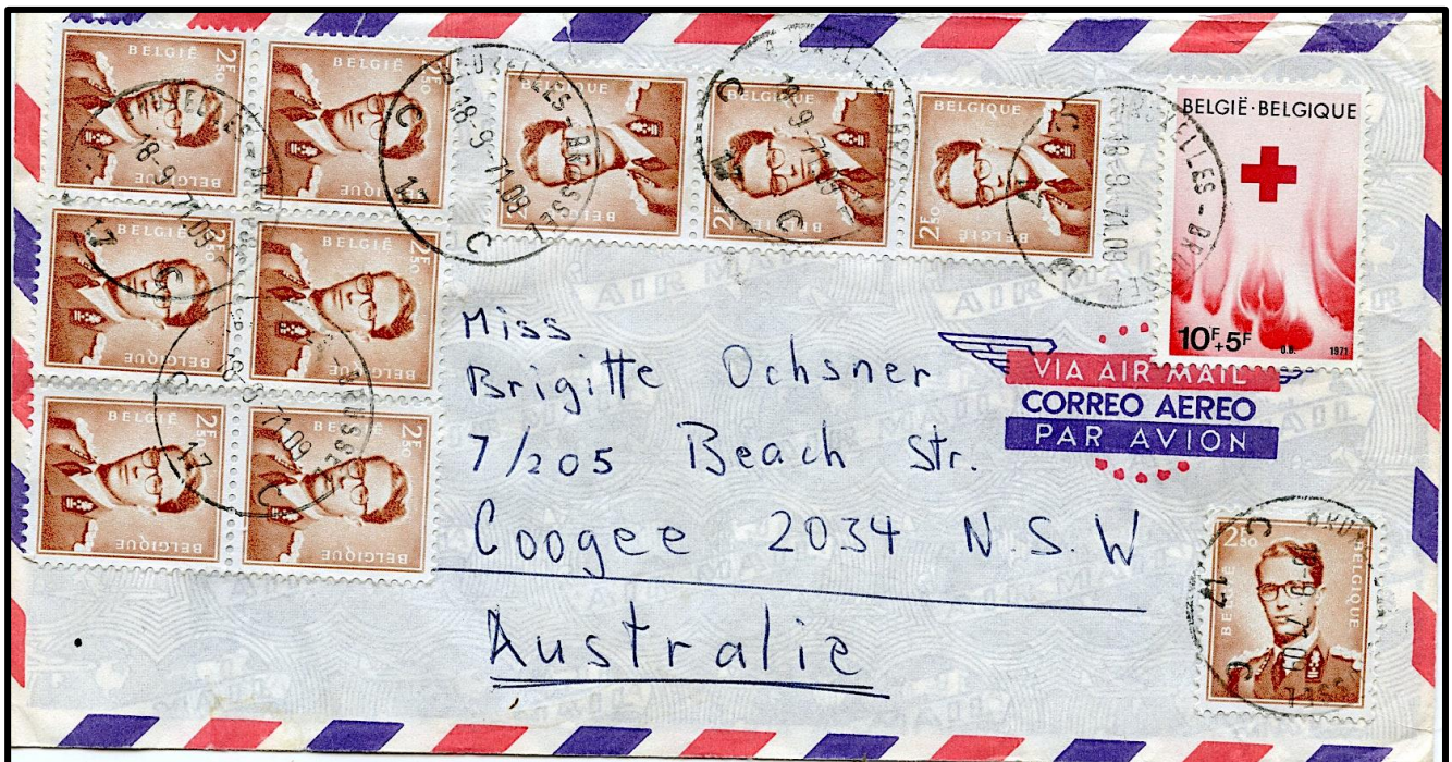
Brief naar Australië van 18 september 1971

Wetende dat de rolzegel van 2,50 F op een verschillende cilinder gedrukt werd, kunnen we hier met zekerheid zeggen dat er hier geen rolzegel gebruikt werd!