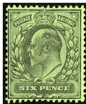
De pseudo-zeldzame zegel