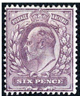
De echte zegel

Honderden kilometer verder, in een trein, telden een man en een dame, die een duidelijke verjongingskuur ondergaan had, het bedrag dat de hebzucht van de handelaars hun opgebracht had: 30.000 US dollar van 1920 !